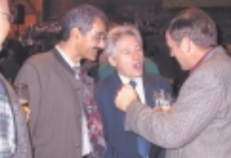
So war es am Oktoberfest 03 im Bauhofstadel. Am 1. Oktober sind wieder alle geladen zu Freibier und guter Laune.