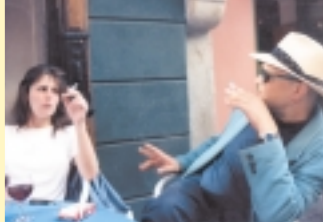
Ein Riesens Publikumserfolg war die Vernissage am Stadtplatz zu Franz Eckers 5. Todestag. Beitrag siehe Seite 5.