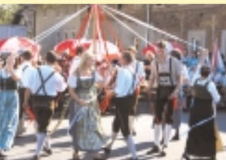
Zum Erntedankfest trat die Leondinger Landjugend zum Bandtanz an. Gleichzeitig feierte Sie Ihr 50 jähriges Jubiläum.