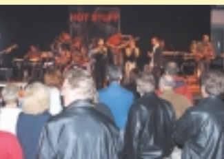
Gut angenommen wurde der Leondinger Musiksommer im Juli, wenn auch das Wetter manches Konzert in das Atrium verweies.