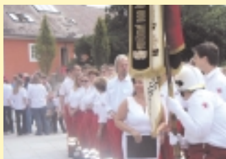
Noch im Juli feierte der Rote Kreuz sein 30 jähriges Bestehen mit Festmesse und Frühschoppen am Stadtplatz.